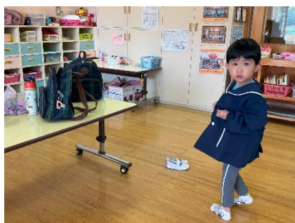
新しいお部屋で支度