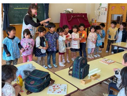
もも組さんにプレゼント