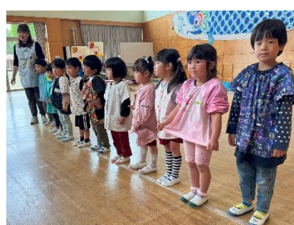
幼稚園の歌を披露したよ