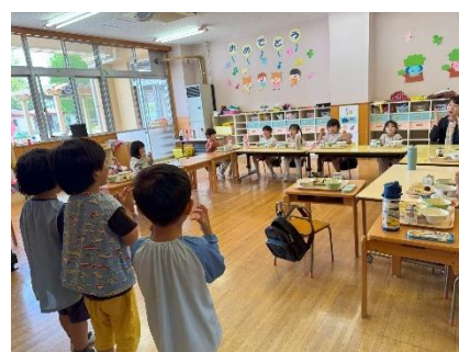
給食のお当番さん