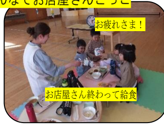
にじ組のお店「なんでもや」…みんなでお店屋さんごっこ

・11月6日と11月13日にはもも組も初の図書館訪問でした。みんな好きな本をササッと選んでいたのが驚きました。 ・11月7日にはにじ組の「おみせやさんごっこ」でした。4人でしたがよく頑張っていました。たくさんの商品を作って当日も元気いっぱい売っていました。いろいろな場面で年長としての“底力”を感じるようになってきました。