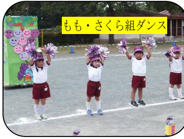
もも・さくら組ダンス