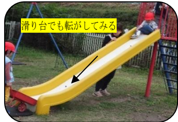
滑り台でも転がしてみる