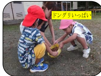
ドングリいっぱい