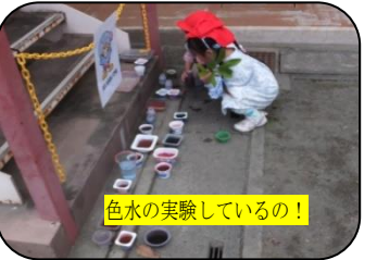
色水の実験しているの!