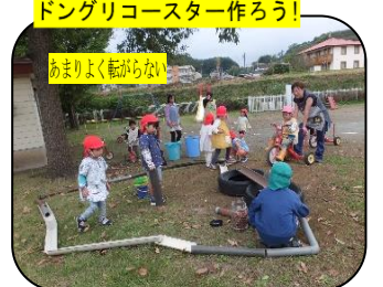
ドングリコースター作ろう!