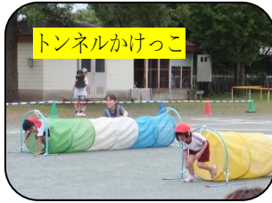
トンネルかけっこ