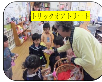
トリックオアトリート