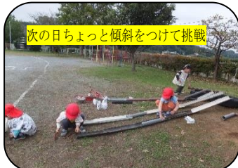
次の日ちょっと傾斜をつけて挑戦