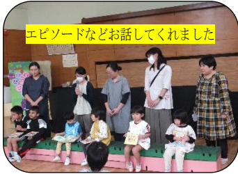
エピソードなどお話ししてくれました

＜お誕生会＞10月14日(金) 6人のお友達お誕生日おめでとう! パチパチパチパチ! <英語教室>10月20日(月)