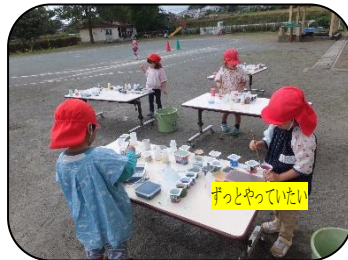
ずっとやっていたい