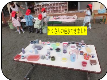
たくさんの色水できました