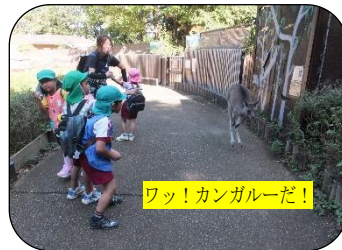
ワッ!カンガルーだ!