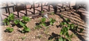
花壇のホオズキとコスモス(4/10)

さて、園は新しいお友達を迎え、お庭にお部屋に、元気な子供たちの声が戻ってきました。様々なものが生き生きとした季節を迎えています。