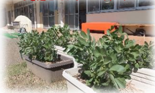
冬を越せたソラマメ(4/10)

一人一鉢で育てたビオラの花がもりもりと咲いています。園の手作り花壇には、昨年種をまいたホオズキの葉が生えてきました。コスモスもこぼれ種から発芽したのでしょうか、たくさん芽が顔を覗かせています。(まさにサステイナブルです。)