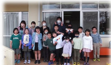
卒園した子供たち(小学生)が、お家の人と園に遊びに来ました(3/29)

また、保護者の皆様には、昨年度同様、幼稚園での活動にご協力をいただくことがあるかと思いますが、保護者の皆様と職員と共に思いを伝え合って、幼稚園の教育活動をすすめていきたいと思っております。ご理解・ご協力をよろしくお願いいたします。