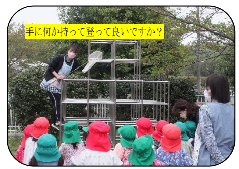
手に何か持って登って良いですか？