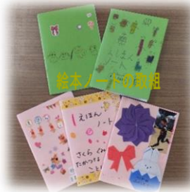
絵本ノートの取組

今年度もこれらの活動を継続していきます。読書活動では、本を読むことで知識を得ることはもちろんですが、様々な登場人物の気持ちを想像することができるようになり、身近な人の気持ちを思いやることから、やがて世の中の出来事を『自分事』と考えられるような、豊かな想像力を持った人になってくれると思います。栽培活動ではいろいろな野菜作りをはじめとして、今年は、手作り花壇（昨年度の園だよりでも紹介しましたが、3人のバス運転手に花壇を作ってもらいました）やプランター、一人一鉢で、お花なども育てていきたいと考えています。さらに、種を取って次の年に繋げていきたいと考えています。また、栽培をする過程での様々な子供たちの気づきも大切に、観察力や育てること（時には失敗することも含め）を通し、命の大切さ、自然の不思議さなど、子供なりに感じられる豊かな感性を育てていけたらと思います。