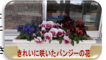
きれいに咲いたパンジーの花

さて、連休も後半に入りました。天気も良さそうです。楽しくお過ごしください。連休明けまた元気に会いましょう。