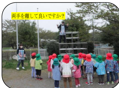
両手を離して良いですか？