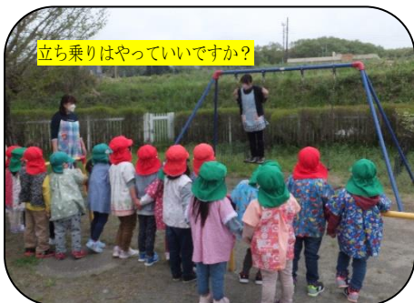
立ち乗りはやっていいですか？