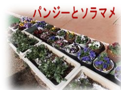
パンジーとソラマメ