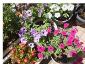
暑い中一生懸命咲いていました

大人になって就いた仕事が教員だったので、ふと思ひ起こしてみれば、幼稚園の時からこの年まで、毎年夏休みを過ごしてきました。夏休みに入る前はワクワク、終わってみれば「今年の夏休みもあつという間だったなあ」という思いを、60年も繰り返してきたこととなります。今年鳩山幼稚園初の試みで夏休み（長期休み）の預かり保育や、幼稚園施設開放「ピジョッコルーム」を実施しましたので、ほぼ毎日子供たちがいました。職員みんな子供たちの様子を見たり保育に入ったりと、例年のような静かな中での仕事ではありませんでしたが、それでも、（あくまでも私個人の気持ちですが）夏休みが終わってしまったことに、何やらさみしさを感じます。皆さんは夏休みどんな思い出が残りましたか？